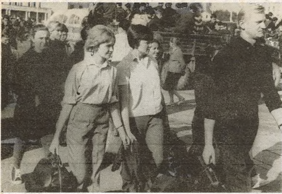
НА ДАПАМОГУ КАЛГАСУ.